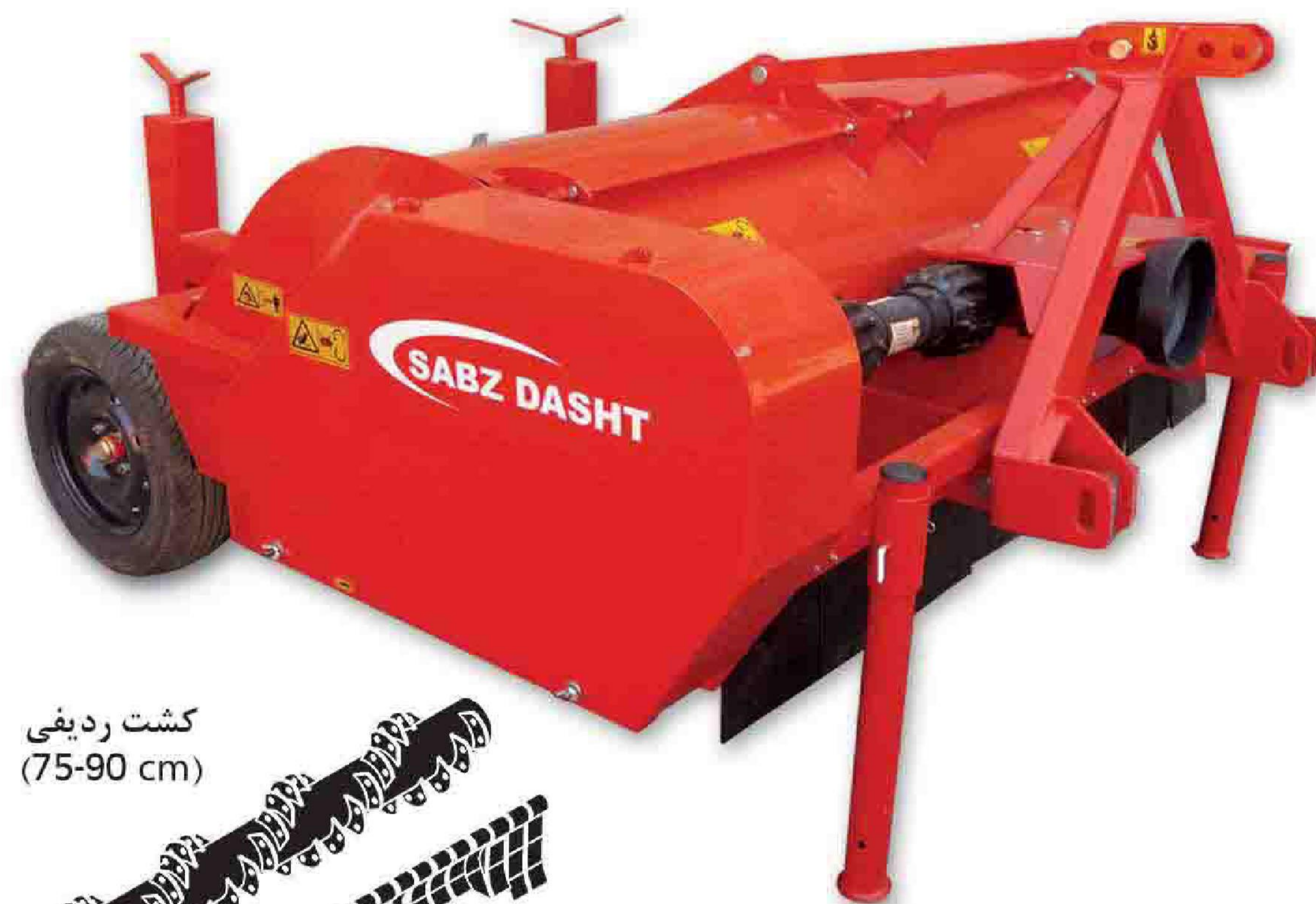
کشت ردیفی (75-90 cm)

- کاهش هزینه برداشت و افزایش ظرفیت و سرعت عملیات برداشت. - با حذف ساقه گیاه، پوست سیب زمینی ضخیم شده و آسیب دیدگی محصول هنگام برداشت کاهش می یابد. - توقف رشد سیب زمینی ها جهت تولیدکنندگان بذر سیب زمینی در برداشت های پیش از موعد.